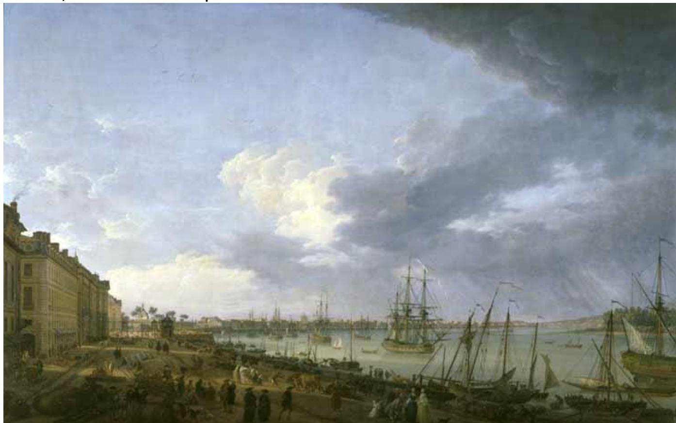
Vlp 14 doc 1