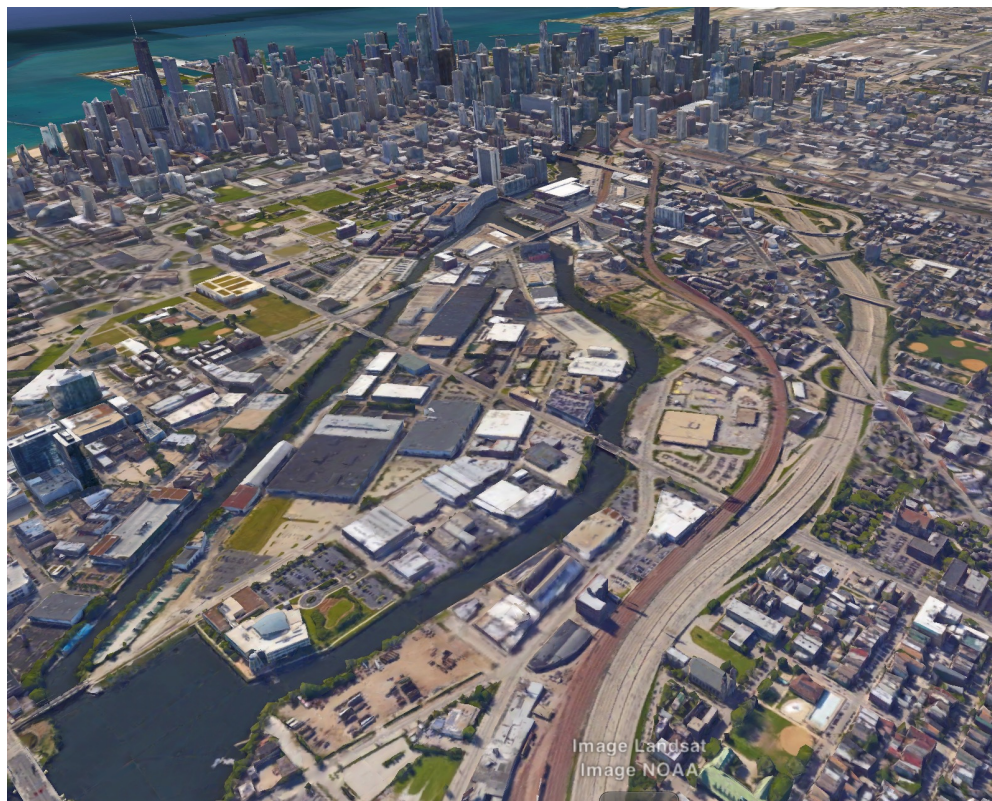
Vue aérienne de Chicago (Google Earth)